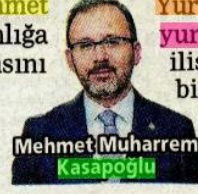
Mehmet Muharrem Kasapoğlu

Gençlik ve Spor Bakanı Mehmet Muharrem Kasapoğlu, bakanlığa bağlı yurtlarda internet kotasını iki katına çıkardıklarını açıkladı. Kasapoğlu, sosyal medya hesabından yaptığı paylaşımda, Kredi ve